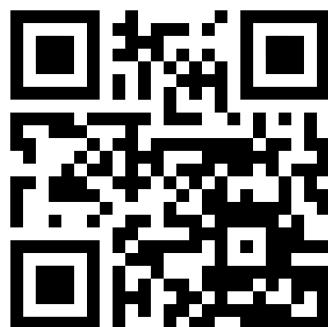
QR Code-Video WWF